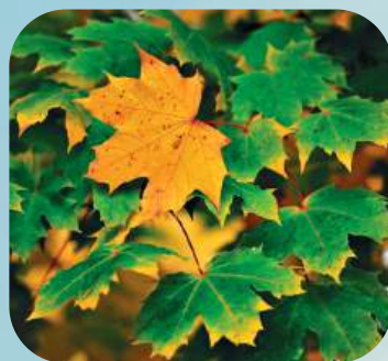
К ... ..