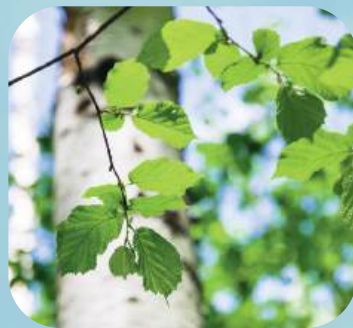
Б ... ..