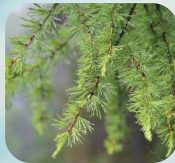
Л ... ..