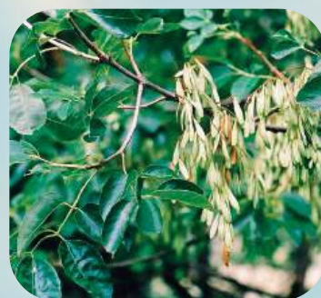
Я ... ..