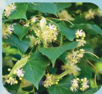
Л ... ..