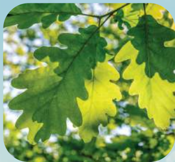
Д ... ..