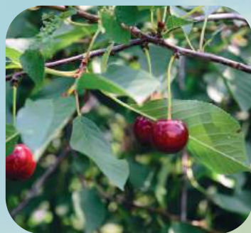
В ... ..