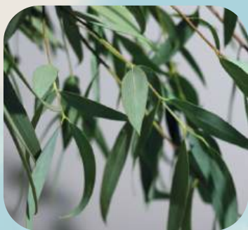
И ... ..