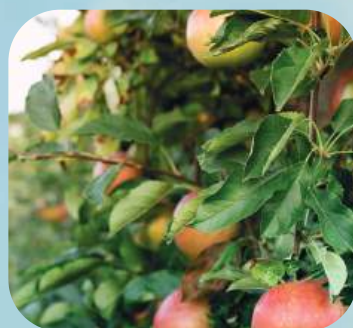
Я ... ..