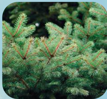
Е ... ..