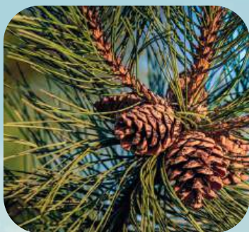
С ... ..