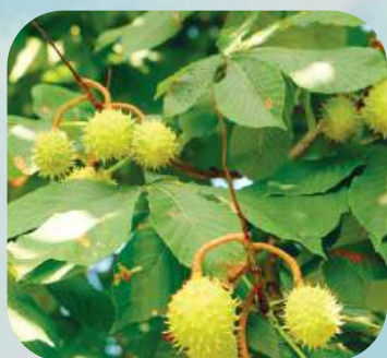
К ... ..