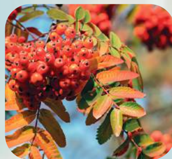
Р ... ..