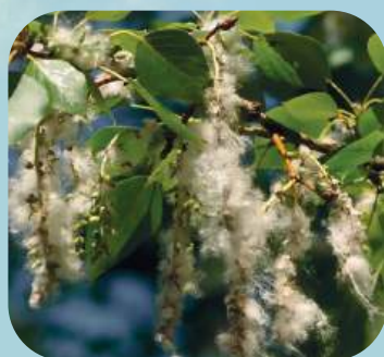
Т ... ..