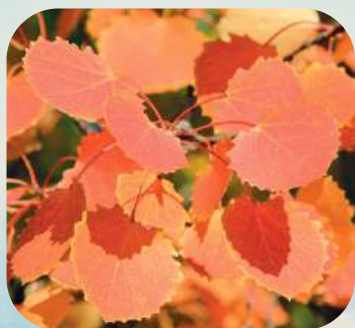
О ... ..